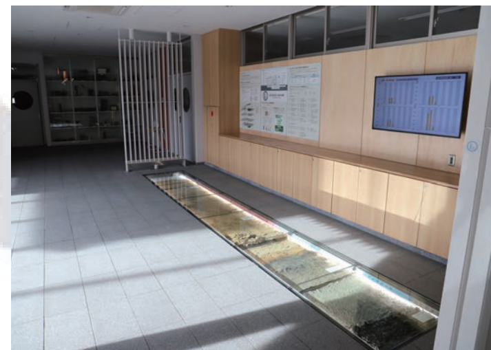
新校舎エントランス

「当時は、大学受験で実績を出すための学力偏重、偏差値主義の教育・指導に傾いてきていました。毎年30～40人は東大に合格していたものの、東大の某サークルの調査で『（海城出身者は）入学後の留年率が高い』と揶揄されてしまったのです。ちょうど創立100周年を迎えるタイミングでもあったので、これを発端に学校改革に着手しました。これが、二つ目の節目です」