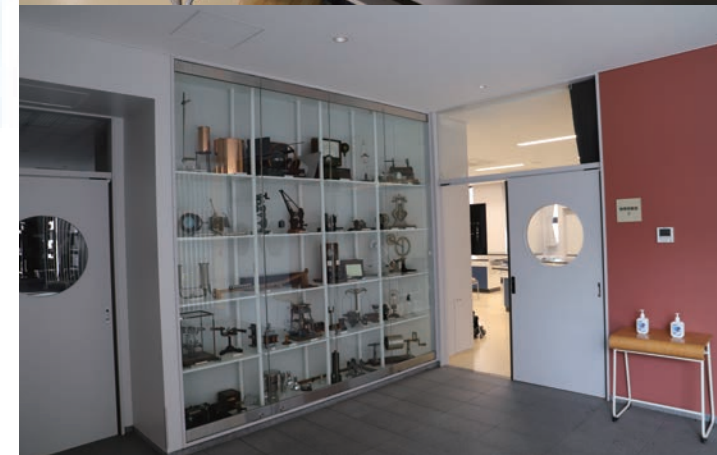
1階物理実験室と入り口（写真上/下）