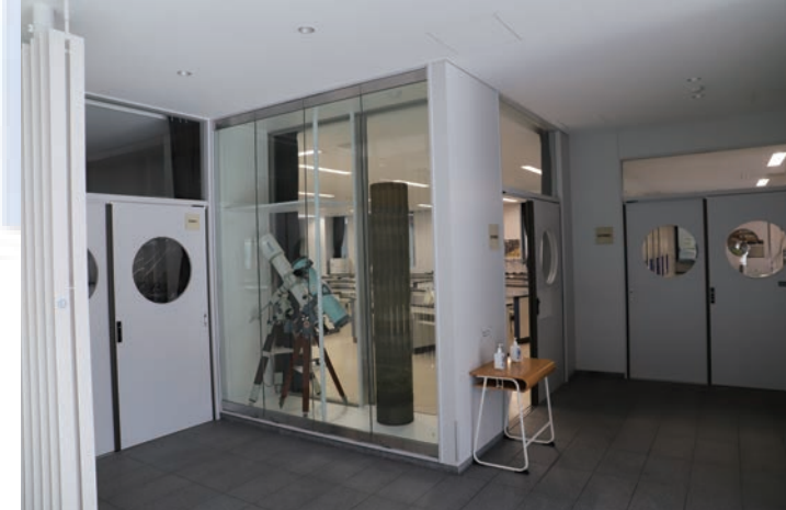
1階地学実験室と入り口（写真上/下）