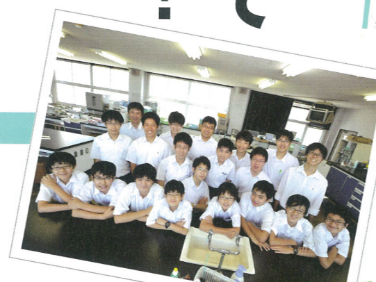
海城中学校・高等学校 生物部