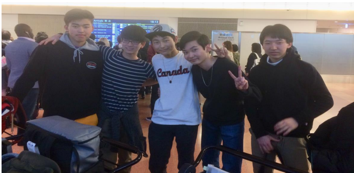
帰国後羽田空港到着ロビーにて