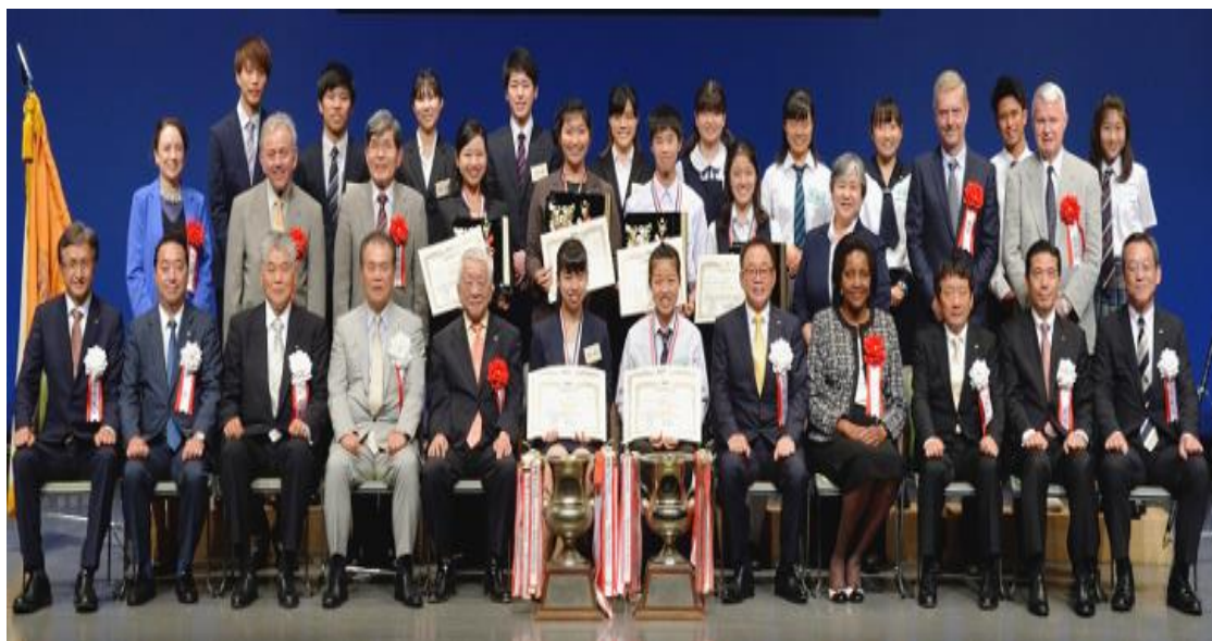
第48回大会表彰式

申し込みは各自でしていただきますが、申し込みをした生徒諸君は口頭で構いませんのでグローバル教育部へその旨報告していただけると幸いです。