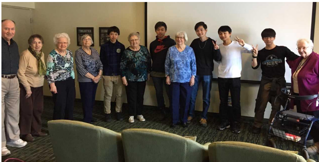
現地在住の方々へのプレゼンテーション

1月5日（土）からカナダ短期留学に参加していた高校1年生5名が3月17日（日）に無事帰国しました。5名はカナダトロント近郊にある2校の公立高校にホームステイをしながら通学しました。帰国前には日本という国を紹介するプレゼンテーションも行い好評だったと現地コーディネーターからレポートが入っておりました。ちょうど生活に慣れてきた頃の帰国となりますので、もう少し残っていたかったというのが正直な気持ちかもしれません。今回の貴重な体験を生かして新年度からも更に頑張っていたきたいと願っています。5名の体験談は新年度のグローバル通信で紹介していきたいと思います。