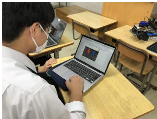
以前本校で実施した際の活動風景